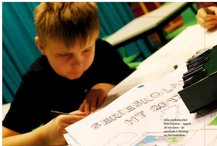
Alla stafetterier från hösten – uppåt 70 stycken – är samlade i tidning, en Serieskolan .

NERE VID DALÄLVEN , i Koppardalen i Avesta centrum, ligger ett gammalt järnverk. Stora hus av grov slaggsten. Järntillverknigen har flyttat utanför samhället, nu görs det kultur här i husen. Serier, till exempel.