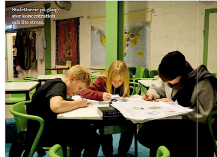
Stafetterier på gång: stor koncentration, och lite stress.

På Axels kvitto stod det inte så mycket.